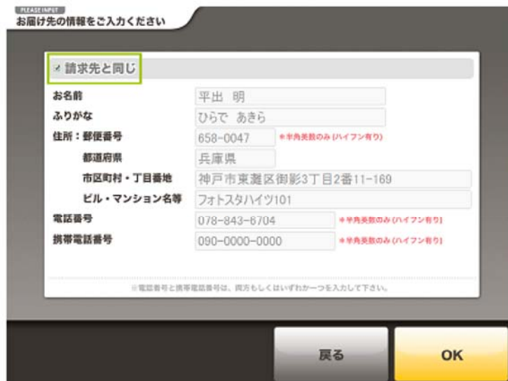
photo-staでは「ご請求先」とは別の「お届け先」に商品をお送りすることができます。(ギフト・プレゼント注文)「お届け先」がすでに入力した「ご請求先」と同じであればそのまま「OK」ボタンを押してください。「ご請求先」とは別の「お届け先」に商品を送付する場合は、「請求先と同じ」チェックを外して、「お届け先」を入力してください。

注文が完了すると、「オーダーリスト(注文確認画面)」が表示されます。「変更」ボタンでオーダーの変更を、「キャンセル」ボタンでオーダーのキャンセルができます。他の商品をオーダーする場合は、「他のサイズもオーダーする」ボタンを押してください。注文内容が正しければ「OK」ボタンを押してください。photo-staでは複数の商品を一度に注文することができます。